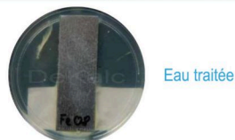
Sur le disque de gauche, des bactéries ont été inoculée ; après installation du dispositif HOMEO DEKALC, on constate très rapidement que les colonies de bactéries sont détruites